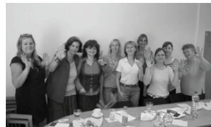
Poslucháčky motivačného kurzu nám solidárne zamávali do kampane Waving...

Týmto sa chceme poďakovať spoločnostiam ADL a FAME consulting za prínosný tréning, ktorým sme sa prezento-