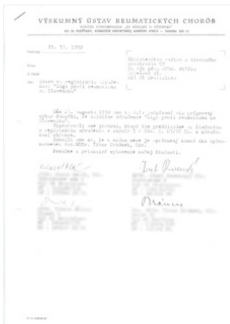
Zakladajúca listina LPRe SR:

V súlade s moderným trendom vo vyspelých spoločnostiach je dôležité, aby pacienti opustili svoj pasívny postoj k vlastnému ochoreniu. Propagujeme aktívnu spoluúčasť pacienta na komplexnej liečebnej starostlivosti. Chorý sa musí stať akoby členom liečebného tímu, ktorý sa oňho stará a sám musí mať pocit spoluzodpovednosti za liečebné výsledky. Pacienti sami preberajú iniciatívu do svojich rúk, sami prednášajú, publikujú, povzbudzujú spolupraciacich a tak vlievajú optimizmus aj ťažšie postihnutým.